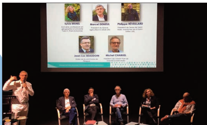
Table ronde au forum de l'alimentation

Le 7 septembre 2022, Saint-Malo Agglomération organisait le 1 er forum de l'Alimentation et de l'Agriculture dans le cadre de l'élaboration du futur Plan Alimentaire Territorial (PAT) de l'agglomération.