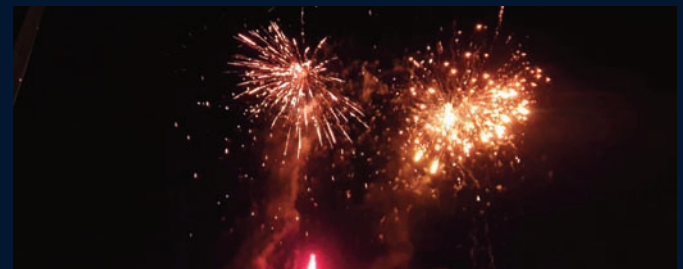
Feu d'artifice du 14 juillet