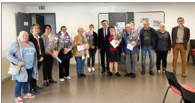
Les lauréats du concours des Maisons fleuries

Samedi 15 octobre, la municipalité a mis à l'honneur les participants du concours des maisons fleuries édition 2022.