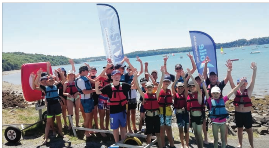
Char à voiles

Téléthon 2022 «Le cross des 2 écoles» A l'occasion du Téléthon l'école des Badiou et l'école Notre Dame s'associent pour participer au cross. Les enfants des 2 écoles ont effectué le parcours par niveau. Le jeudi matin ce sont les enfants des écoles maternelles qui ont ouvert les festivités. Le vendredi les plus grands se sont lancés dans des parcours tracés au stade. Chaque parcours était mesuré et adapté à la tranche d'âge concernée. Les enfants se sont préparés pendant 1 mois à cet événement dans le cadre du sport à l'école. Ce sont près de 300 élèves qui ont participé à cette aventure. Chaque enfant devait verser un don (dans le cadre du Téléthon) pour obtenir son dossard de course. 850 euros ont été récoltés pour ce cross 2022. Ce qui constitue une belle performance ! Bravo les enfants !