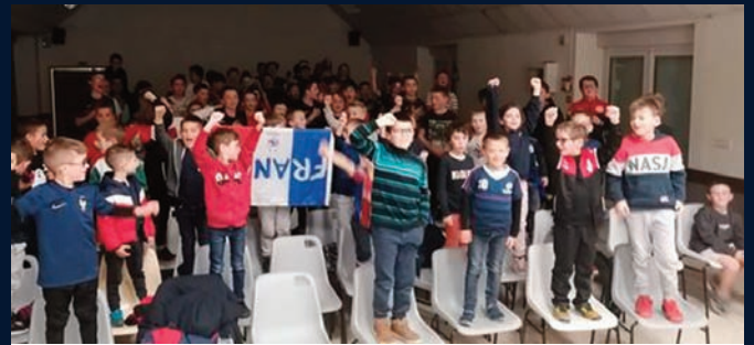
Les enfants et la coupe de monde de foot