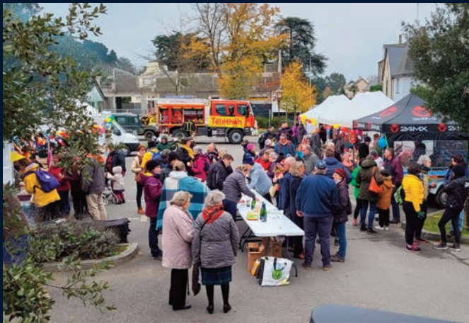
Telethon aperitif offert par la municipalite