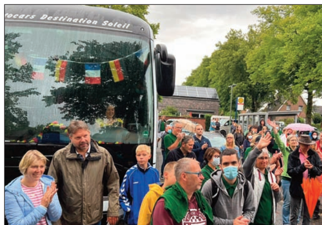
Le départ de la délégation de Plerguer

L'Europe et la Paix en filigrane La semaine a bien entendu été marquée par quelques temps forts officiels, plus «politiques» au sens noble du terme. Comme l'a fait Monsieur le Maire, qui était accompagné de 3 autres membres du conseil municipal, et les intervenants allemands, ce sont les thématiques de paix, de démocratie, de liberté qui ont été évoqués dans les différents discours, avec notamment le rôle essentiel que joue et doit jouer l'Europe, ceci dans le contexte international de cette guerre en Ukraine, aux portes de l'Europe.