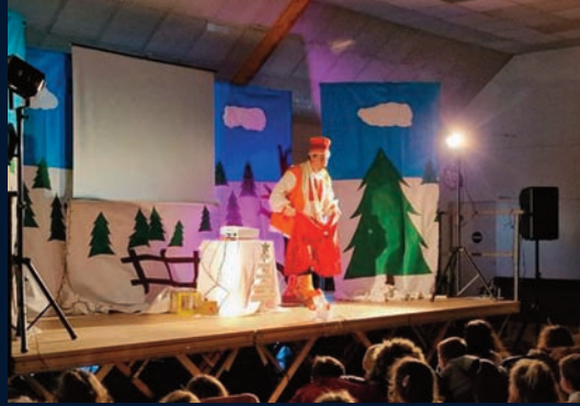
spectacle de Noel des enfants