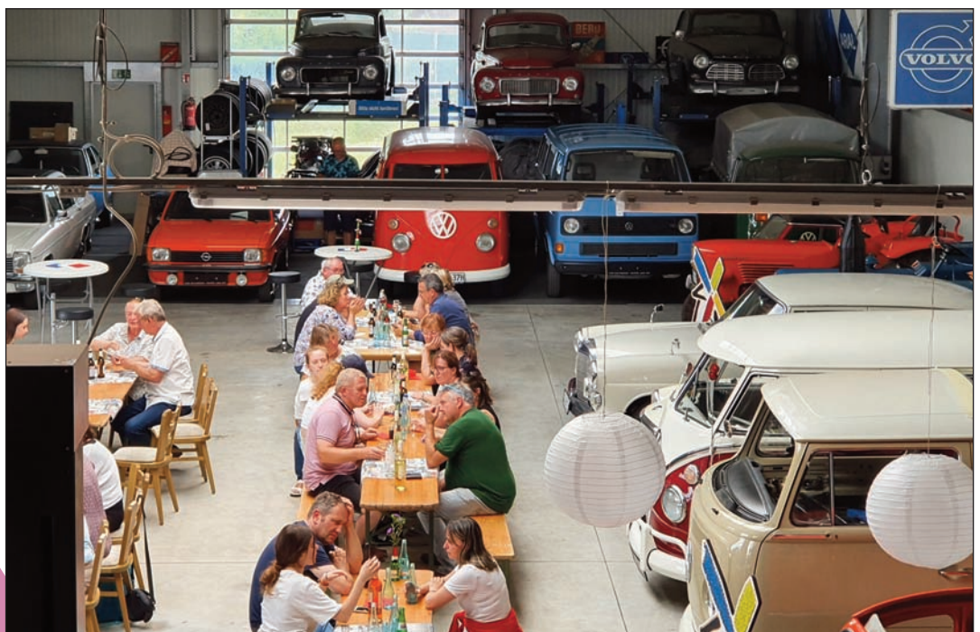
Déjeuner à Lette au milieu des voitures de collection