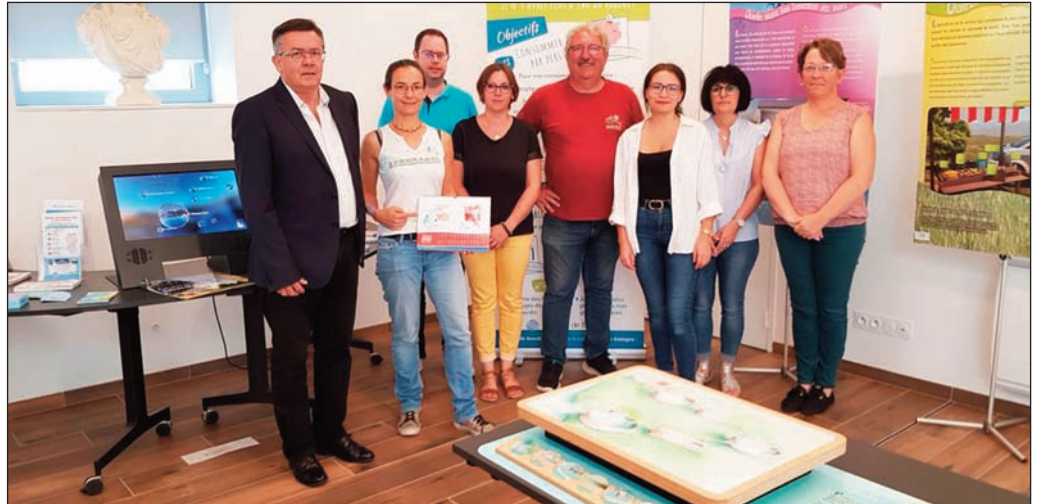
Ouverture de l'exposition

tamment de manière ludique sur le cycle de l'eau (d'où vient-elle ? à quoi sert-elle ? Comment la préserver ?). La sensibilisation sur l'eau et son usage raisonné est très importante surtout cette année où nous avons connu des épisodes de sécheresse et où nos réserves de Beaufort et Mirloup ont atteint des côtes d'alerte.