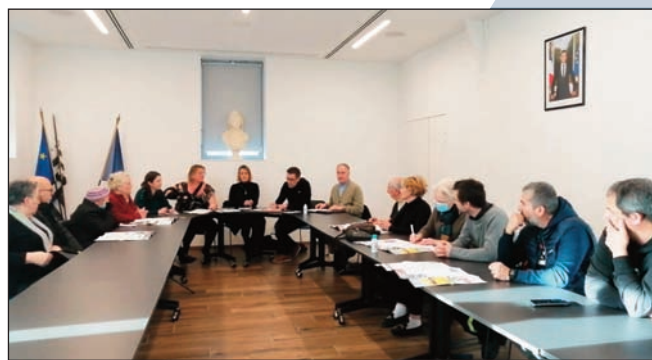
Réunion de quartier du 26 novembre

leur quartier ou village et plus généralement de la commune. Ces moments ont ainsi permis d'aborder différents points, tels que notamment la circulation et la vitesse, l'aménagement des carrefours, l'éclairage des villages, l'entretien des voies... Certaines réponses ont pu être apportées pendant ces réunions, d'autres le seront dans la mesure du possible au travers des comptes-rendus qui seront remis aux participants et à ceux qui en feront la demande. Cette démarche va se poursuivre au cours de la seconde moitié du mandat afin de toujours être à l'écoute et d'entretenir un dialogue démocratique. Dans le même esprit, vous avez aussi la possibilité de rencontrer les adjoints et les conseillers municipaux délégués lors de leur permanence à la mairie.