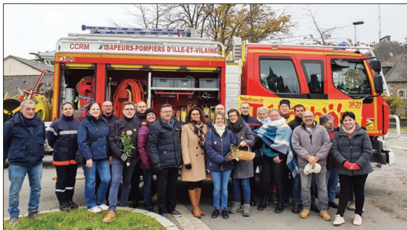
Organisateurs et participants du Téléthon

Comme à son habitude, la municipalité a tenu à organiser le Téléthon à Plerguer.