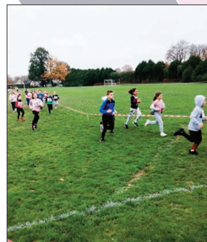
CROSS des écoles pour le Téléthon