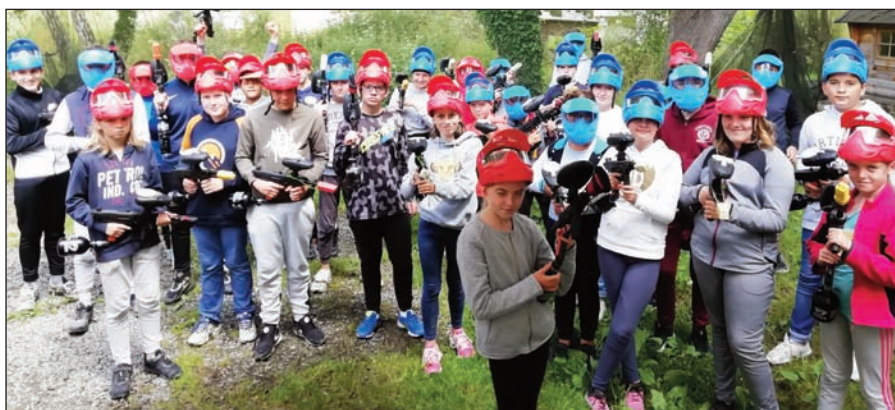
Sortie jeunes paint ball

Pendant les vacances de la Toussaint La 1 ère semaine, les jeunes se sont rendus à Alligator Bay, au lasegame de Rennes et au parcours