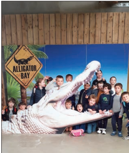
Sortie à Alligator bay

ainsi qu'un stage de voile à Saint Suliac. D'autres activités se sont ajoutées telles que les activités sportives et manuelles proposées par les animatrices et animateurs. Pendant les vacances de la Toussaint ce sont le bowling, le laser game et la sortie à Alligator bay qui ont ravi les petits comme les grands ! Lors