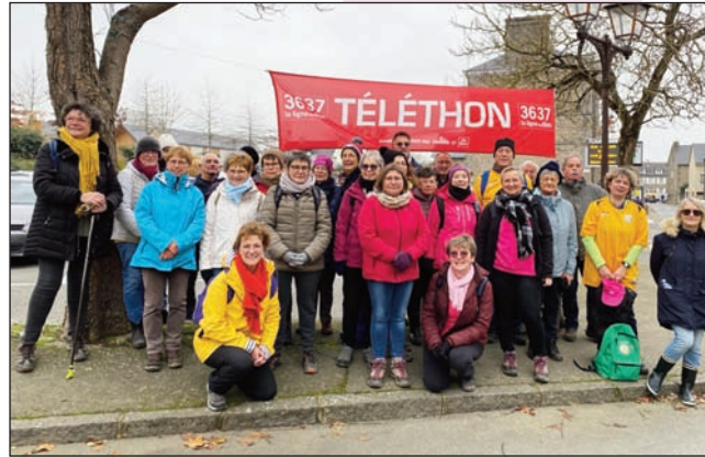
Les 1000 pattes au Telethon