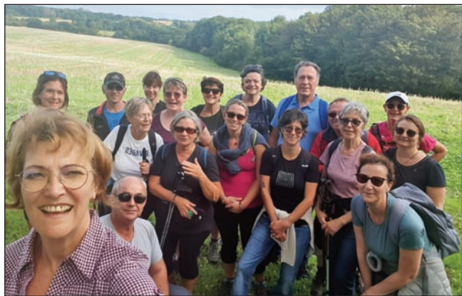
Les 1000 pattes en sortie bord de mer