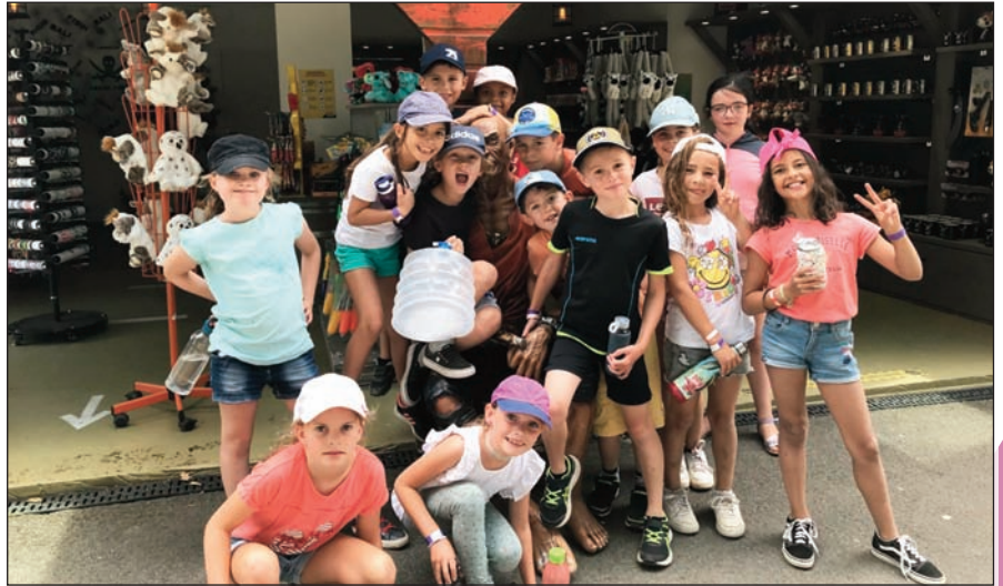
Sortie à Champrepus

L'été 2022 a permis à 68 enfants de participer aux activités et sorties organisées par l'équipe d'animation ; entre autres : Cobac Parc, piscine Aquamalo, zoo de Champrepus, parc Ange Michel