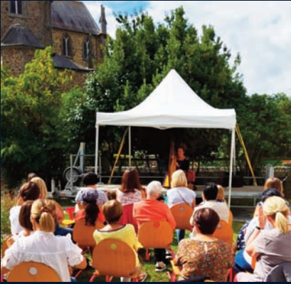
Animations a la bibliotheque pour le 30 eme anniversaire