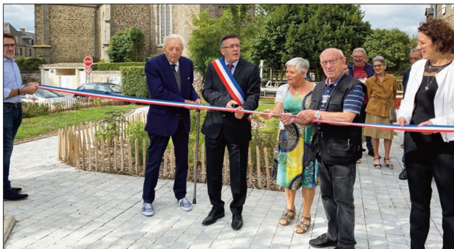
Inauguration de l'espace lecture

Exposition Route du Rhum Sur la période de la course, les élèves et lecteurs ont pu se replonger sur cette épopée avec une exposition détaillant l'événement année par année. Un petit quizz a été proposé aux classes du CE au CM de chaque école.