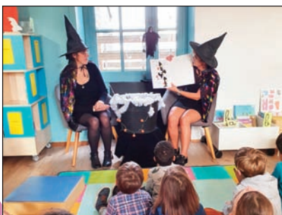
Animation "Attention aux sorcières"

Les élèves ont pu profiter de l'exposition expliquant la création d'une bande dessinée basée sur la bd 'imbattable. Animation Halloween 19 octobre 2022 "Attention aux sorcières" a réuni 25 personnes, avec un moment convivial autour d'histoires et d'un temps de jeu de société animé par Bois des Ludes de Tinténiac, le tout clôturé un petit goûter