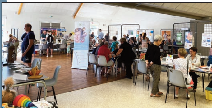
Le forum des associations

Vendredi 2 septembre 2022, le forum des associations a tenu toutes ses promesses avec la présence de dix-neuf associations plergueroises.