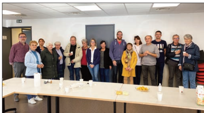
Réunion de quartier du 8 octobre

Forts de cette expérience et de l'accueil favorable à cette démarche des Plerguerquois, nous nous sommes engagés, dans notre programme électoral de 2020, à poursuivre ces réunions de quartiers et de villages. Notre volonté est de maintenir voire de développer une relation de proximité entre élus et habitants au cours de ces moments d'échanges essentiels à tout point de vue. Cependant, la crise sanitaire que nous avons traversée a perturbé la mise en place de ces réunions et ce n'est qu'au cours de ce dernier semestre qu'elles ont pu avoir lieu. C'est ainsi sept réunions qui ont permis aux élus référents de venir à la rencontre des habitants et d'échanger avec eux sur les aspects de «la vie quotidienne et du cadre de vie» de