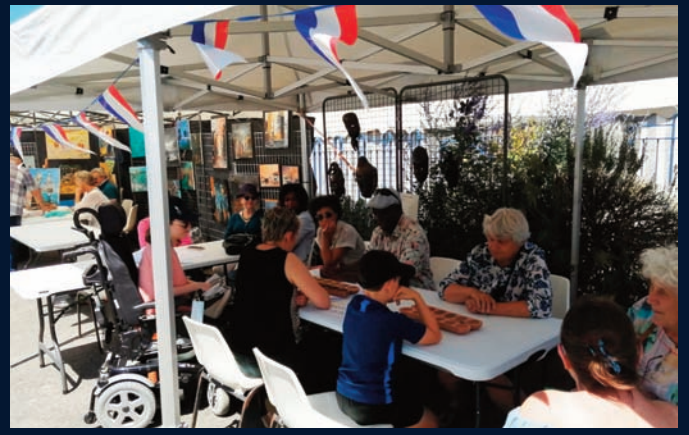
Fete de la culture jeu de l'awale