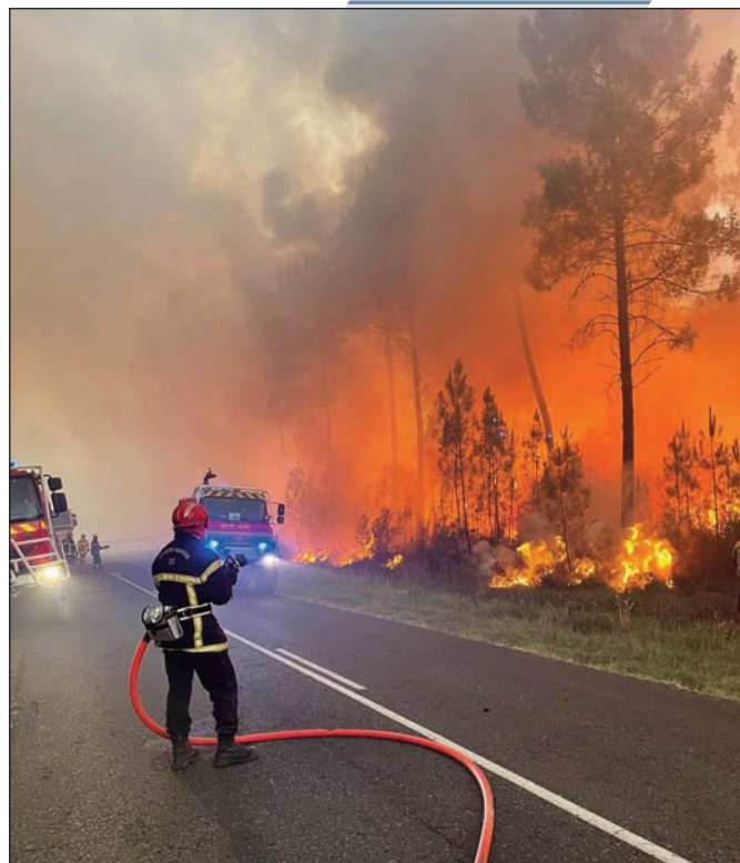
La fournaise des Landes

nous avons tous besoin d'eux. Mais pour fonctionner dans les meilleures conditions, le centre de secours de Plerguer a besoin d'effectifs suffisants. C'est la raison pour laquelle il cherche toujours à recruter de nouveaux volontaires. Vous pouvez venir au Centre de Secours les rencontrer ou téléphoner le samedi matin au : 02.99.58.12.86.