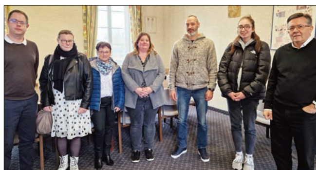
Les agents recenseurs