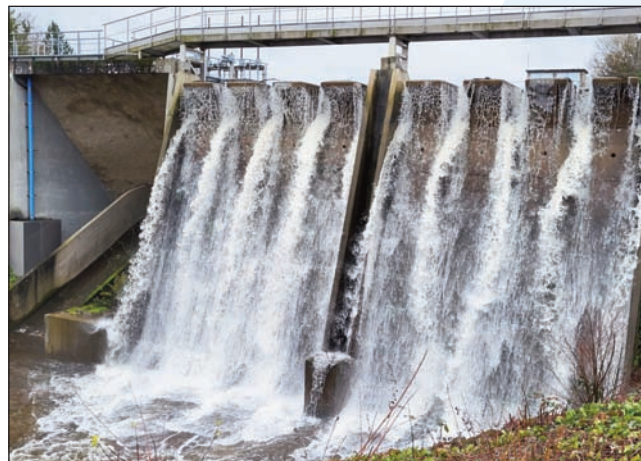
Beaufort le 28 décembre 2022