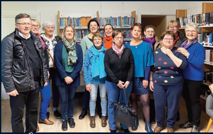
Les benevoles de la bibliotheque