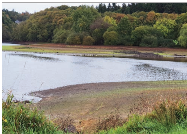
Beaufort en octobre 2022