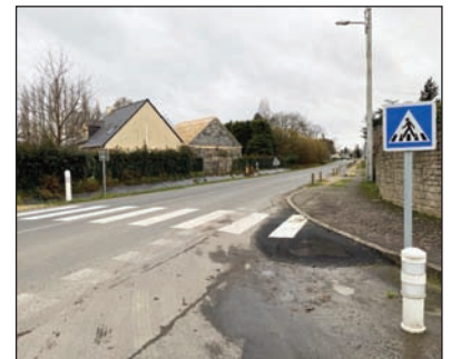
Traversée piétons sur la RD676 au carrefour de La Croix du Fresne

Les 3 logements sociaux réalisés sous maîtrise d'ouvrage de la SA HLM La Rance sont livrés et occupés. Ce programme marque la fin de l'opération urbaine du Puits Saliou. Une remise à niveau des espaces extérieurs va pouvoir être opérée à titre définitif avant une rétrocession dans le domaine public communal.