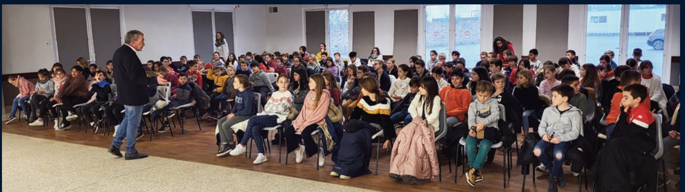
Sensibilisation des élèves des écoles pour le nouveau CM des enfants