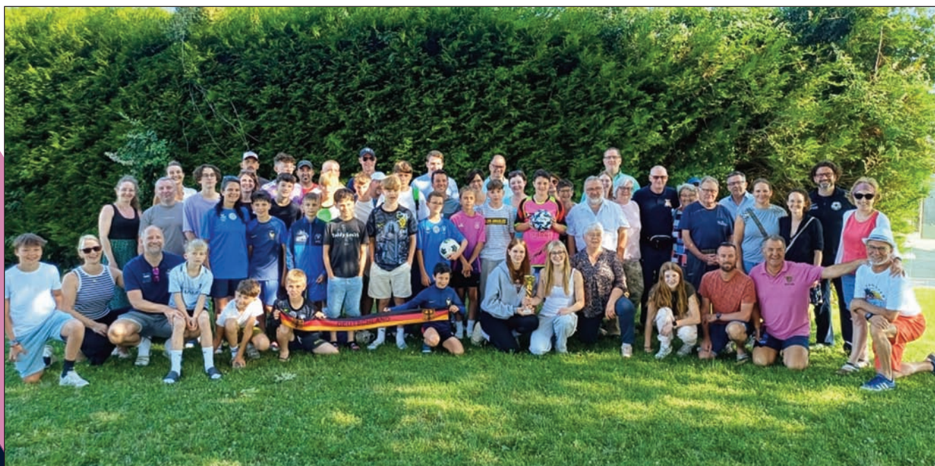
Challenge des Badious avec la délégation allemande