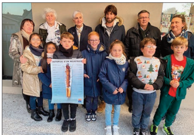
Ecole des Badiou

commence ici » avaient déjà été implantés aux entrées des écoles avec les mêmes objectifs de sensibilisation. Madame PRIOUL a pour sa part insisté auprès des enfants sur les dangers du tabac.