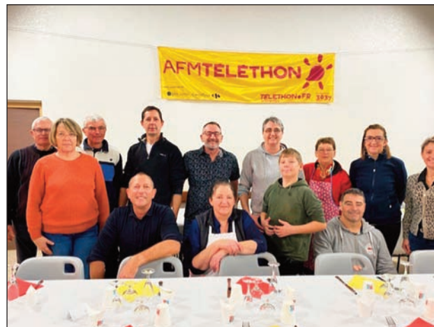
Les bénévoles de la restauration du soir

Les enfants de J2N ont parfaitement joué de leurs instruments pour nous offrir un intermède musical. Les sportifs étaient également au rendez-vous en proposant randonnée pédestre et à VTT ou course à pied (notamment avec présence d'une joëlette). Même les pompiers et le Père Noël étaient là ! Le soir, un repas dansant géré par le comité des fêtes a rassemblé plus de 200 personnes. Merci encore à toutes et tous et un grand merci à nos associations ! Ce bel élan de solidarité a permis de récolter la somme de 6 908,07€.