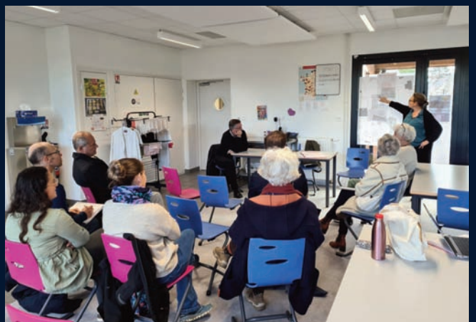
Visite de la cantine par une délégation de St Sulpice