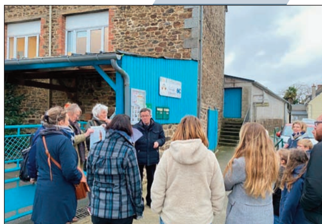
Ecole Notre Dame