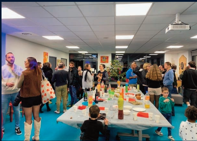
L'espace Jeunes, pot de fin d'année