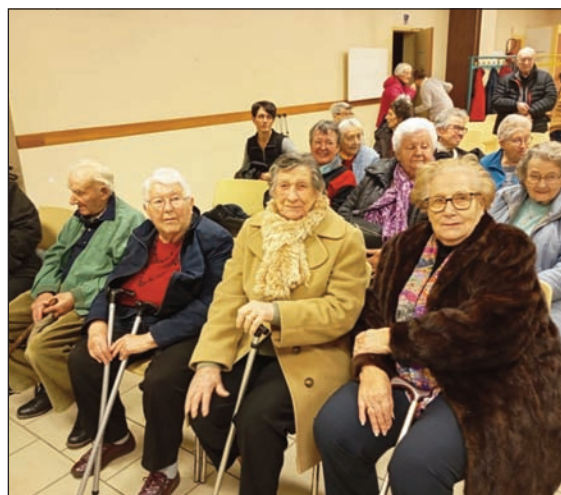
Le 11/12/2025, animation chorale de St Suliac

Que cette nouvelle année apporte santé, joie et bonheur à toutes les personnes aidées ainsi qu'à leur famille. Que cette année 2026 nous permette de maintenir la solidarité et l'attention que chacun d'entre nous peut apporter à son voisin. Venez nous rejoindre, osez le bénévolat !