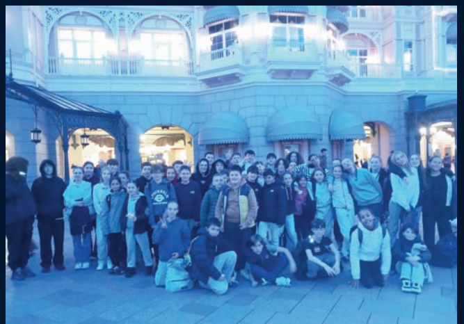
L'espace Jeunes à Disney Land