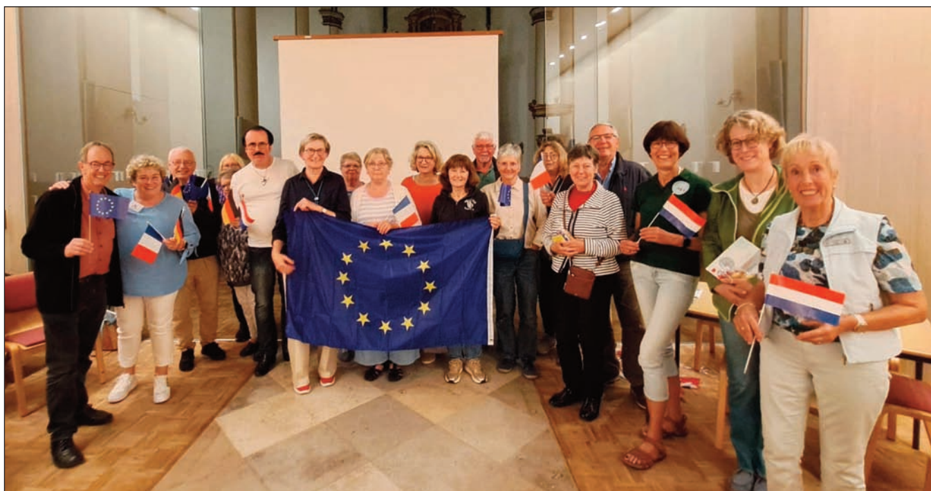
Echanges sur l'Europe