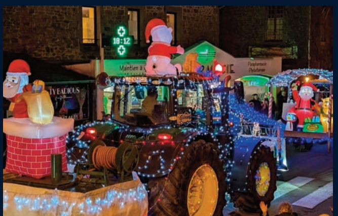
Les tracteurs illuminés