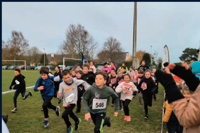
Le cross des enfants