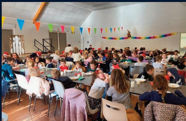
Le repas de Noël des écoles