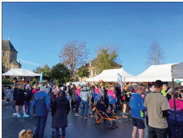
Le village Téléthon

Ainsi, le village Téléthon a-t-il pu être installé sur le parking de la bibliothèque et non pas à la salle Chaubriand. De nombreuses associations ont comme à l'accoutumée répondu à l'appel de la municipalité pour ce grand rendez-vous solidaire en proposant de la vente à emporter (alimentaire ou décorative), des démonstrations et des animations.