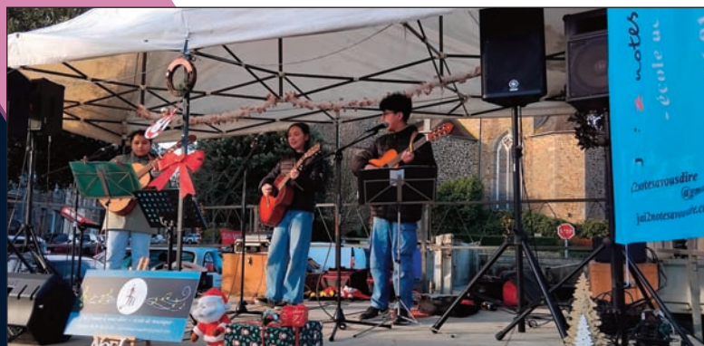
Prestation musicale au Téléthon

L'année 2025 se termine en beauté avec encore une belle équipe de petits et grands guitaristes et pianistes.