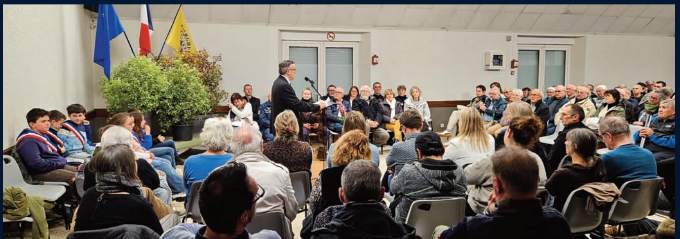
Cérémonie des vœux