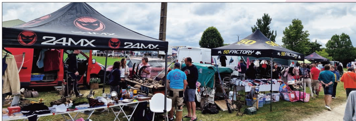
Le vide grenier