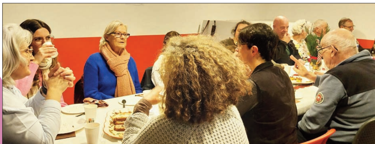
Le 05/12/2025, moment de convivialité ADMR bénévoles et salariés.