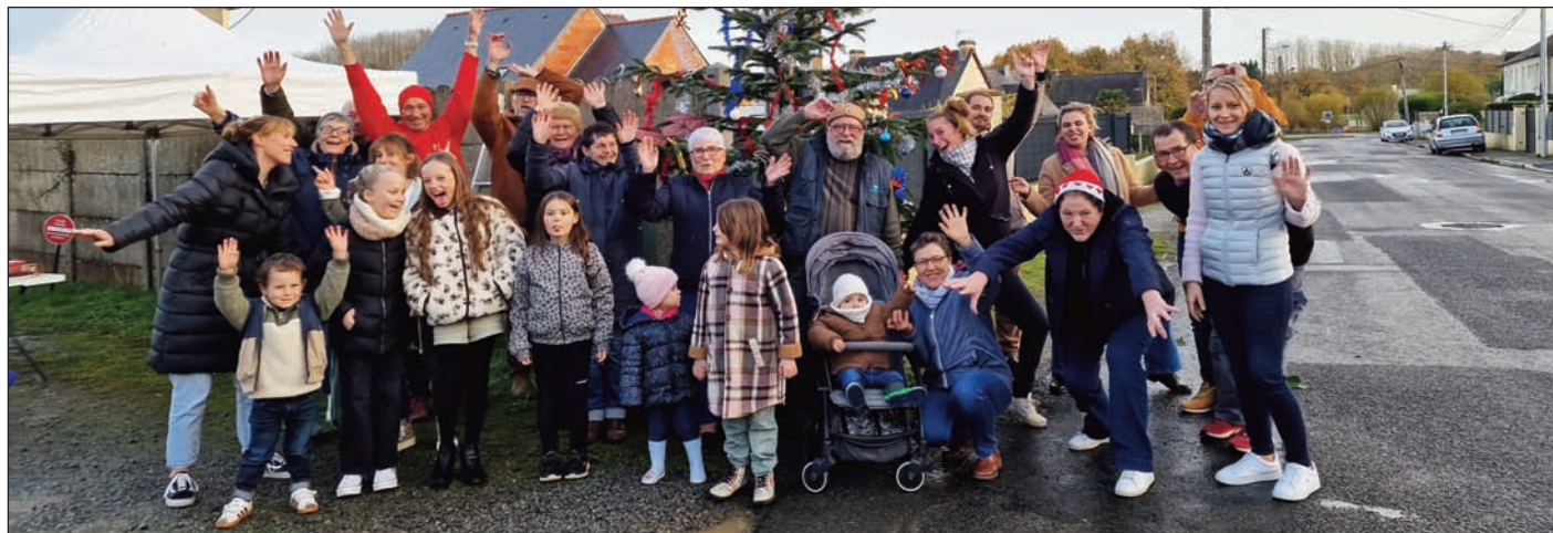
Rue de Beaufort

Ainsi, cette année, 20 sapins ont été réservés et décorés pour mettre joliment en valeur notre belle commune en ses quatre coins. Une belle initiative appréciée de tous et qui a permis de bons moments de convivialité et de partage entre voisins !