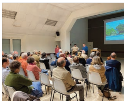
L'îlot des écoliers, restitution du scénario